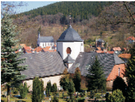
La vista della chiesa dal sud-ovest

Dando che la città di Ruhla è stata maggiormente risparmiata dalle distruzioni della prima e seconda guerra mondiale anche la chiesa di St Concordia non ha subito i danni. Ed é per questo che la nostra chiesa si è savata intatta sin da quando era costruita.