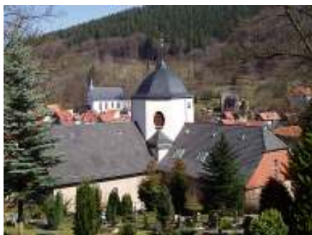
Na prospekte je pohľad na kostol z juhozápadu

Keďže Ruhla bol počas svetových vojen mimo bojových konfliktov, bol aj kostol sv. Concordia uchránený od ničenia. A tak je jediným kostolom, zachovaným v originálnom stave.